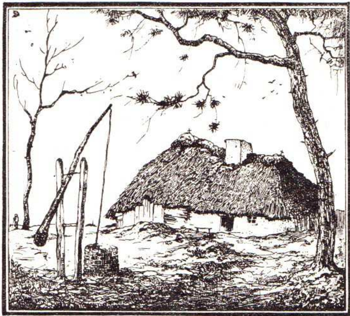
DE HUT TE ZAMMEL