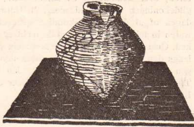
Aschkruik op Kattenbosch.