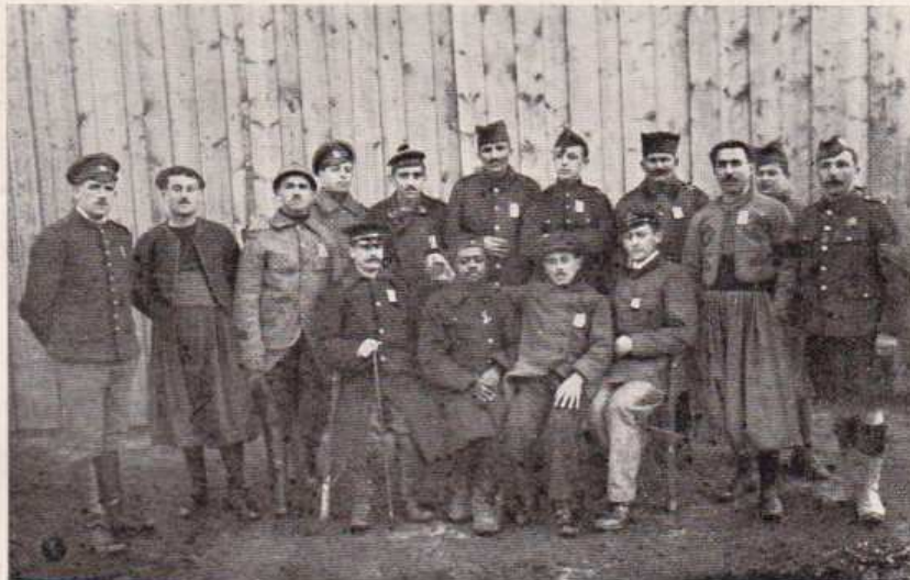
CAMP DE CELLAGER (HANOVRE)